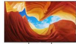
Pieds en position central