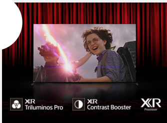
Image ultra lumineuse, expérience cinéma ultime