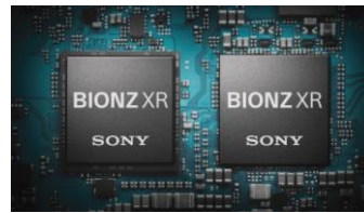
Nouveau processeur BIONZ XR 8x plus puissant (vs BIONZ X)

Taille: 114.8 x 67.5 x 54.2mm Poids: 377g nu / 484g en kit (avec batterie et cartes) Dans la boîte : batterie NP-FZ100 – courroie de cou – Capuchon boîtier – bonnette anti-vent – (version KB + objectif SELP16502 et capuchon optique)