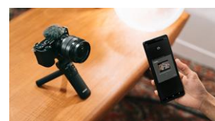
Streaming sans fil direct depuis l'appareil