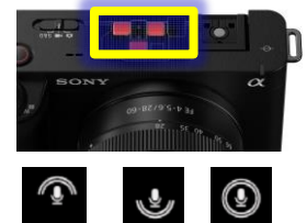
Micro directionnel intégré