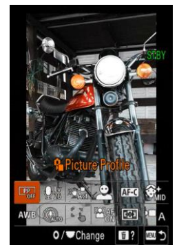
Affichage menu vertical