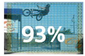
AF 759pts Detect. de Phase 93% du cadre