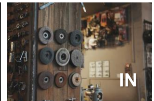
Rendu d'image créatifs photo et vidéo