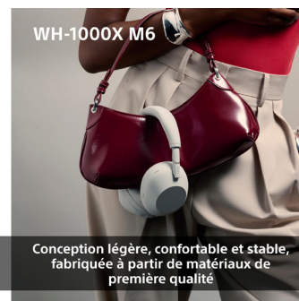
Conception légère, confortable et stable, fabriquée à partir de matériaux de première qualité