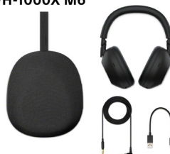
Contenu de la boîte