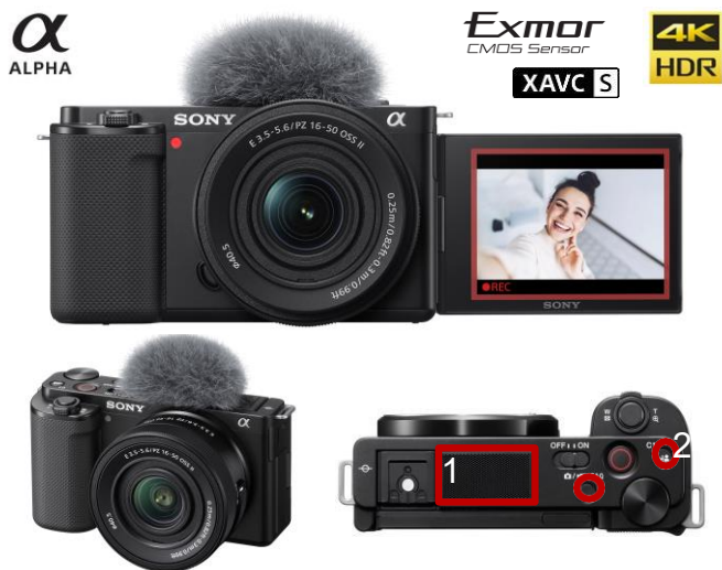
Kit avec optique 16-50mm II (version K)

Le ZV-E10 est l'appareil Photo & Vidéo de voyage indispensable pour tout les jours et les voyages. Avec son capteur 24 Mp, son écran orientable, son micro digital intégré, il est la boîte à outil idéale pour revenir de voyage avec le maximum de belles images et de vidéos incroyables. Maintenant en kit avec le nouveau E 16-50mm F3.5-5.6 OSS II.