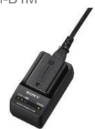
Batterie NP-FW50 Chargeur BCT-RW