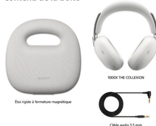
Étui rigide à fermeture magnétique