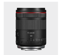
RF 50mm F1.4L VCM