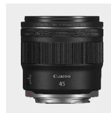
RF 45mm F1.2 STM