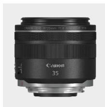
RF 35mm F1.8 MACRO IS STM