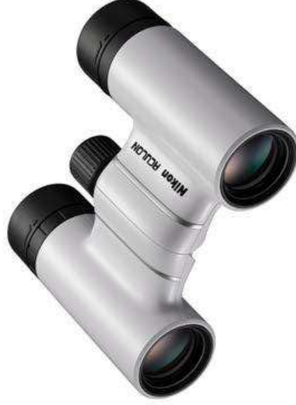
ACULON T02 8×21 <Blanc>