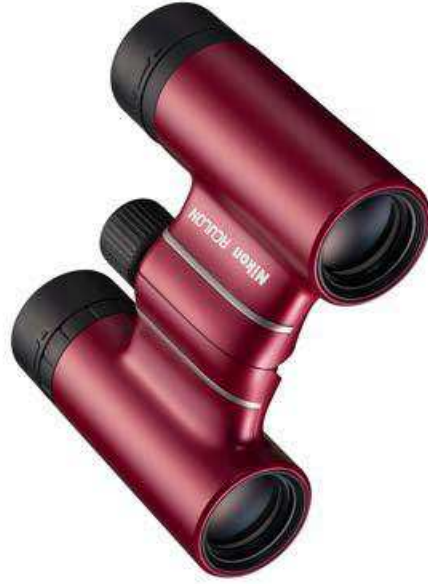
ACULON T02 8×21 <Rouge>