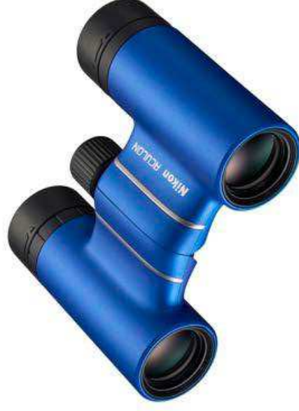
ACULON T02 8×21 <Bleu>