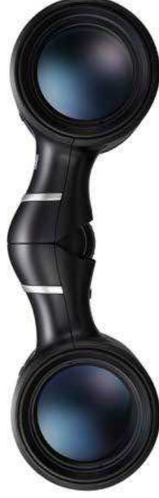
ACULON T02 10×21 <Noir>