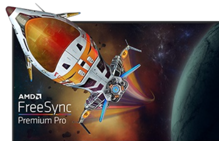
TECHNOLOGIE FREESYNC™ PREMIUM PRO

La dalle Fast IPS garantit non seulement des scènes de champ de bataille vives et de haute fidélité affichées avec une précision de couleur exceptionnelle, mais elle offre également un temps de réponse d'image en mouvement (MPRT) exceptionnel de 0.5 ms.