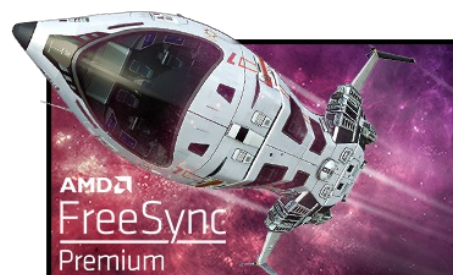
Technologie FreeSync™ Premium

La Résolution UHD (3840 x 2160), plus connu sous la dénomination 4K, vous offre une zone d'affichage gigantesque avec 4 fois plus d'espace d'information et de travail qu'un écran classique en Full HD. En raison de sa haute densité de points par pouce (DPI), il affichera des images incroyablement fines et pointues.