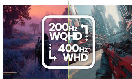
DUAL MODE – ADAPTEZ LA VITESSE!

Inspirée par la courbe de l'œil humain, la courbure de l'écran 1500R garantit une expérience de visionnement réaliste et confortable vous permettant de vous immerger vraiment dans le jeu.