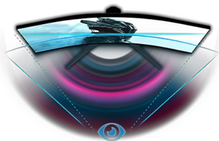
DESIGN COURBÉ 1500R

Les visuels sont encore affinés avec le DisplayHDR 400, apportant une luminosité et une clarté réalistes à chaque image. Pour garantir que votre visée soit aussi nette que l'image, la nouvelle fonction de réticule Target Assist offre une précision de niveau matériel.