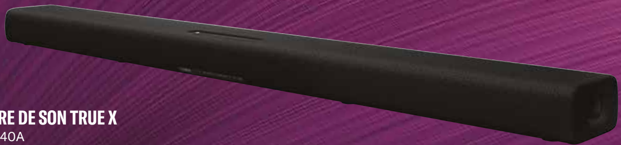
BARRE DE SON TRUE X SR-X40A