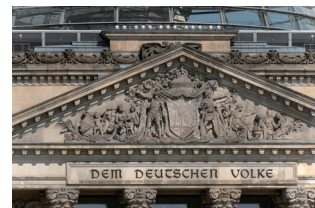
Exposition : 1/3200 s, F/6.3, ISO 400