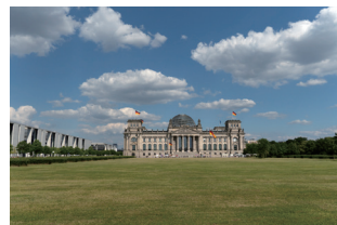
Exposition : 1/4000 s, F/6.3, ISO 400