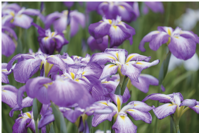
Focale : 300mm | Éclairage : 1/200 s, F/6.3, ISO 100

Le 18-300mm F/3.5-6.3 Di III-A VC VXD couvre une plage focale étendue allant d'environ 27mm à 450mm (équivalent plein format). C'est le premier 1 zoom au monde permettant un grossissement 16,6x pour les appareils photos APS-C. Il offre tous les avantages des zooms polyvalents adaptés à un grand nombre de situations. La formule optique a été soigneusement déterminée, et comprend plusieurs verres spéciaux permettant un zoom 16,6x sans compromettre la qualité de l'image. La résolution depuis le centre jusqu'au bord de l'image reste constamment élevée sur l'ensemble de la plage focale. Comme pour la plupart des autres objectifs de Tamron pour les appareils systèmes hybrides, le diamètre du filtre est de 67 mm.