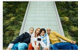
Grand angle 18mm