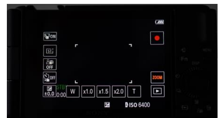
Gestion de tous les réglages, navigation facilitée dans les menus