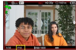
Gestion automatique de la profondeur de champ et de la mise au point