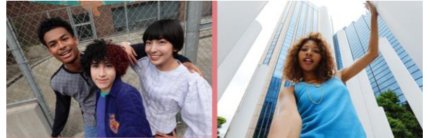
Cadrage optimal pour les vlogs