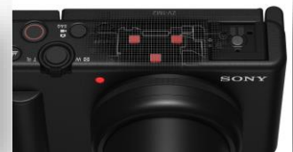
Micro directionnel 3-capsules intelligent

Un boîtier compact conçu pour le vlogging