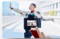
Ecran tout tactile