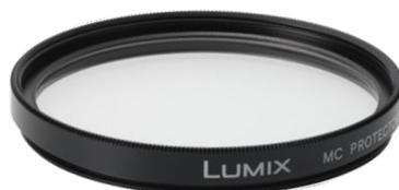
Filtre de protection (diamètre 46mm) / DMW-LMC46E EAN : 5025232438419