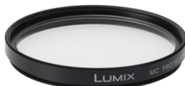
Filtre de protection (diamètre 46mm) / DMW-LMC46E EAN : 5025232438419