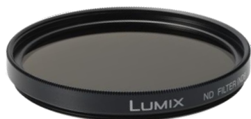
Filtre ND (diamètre 46mm) / DMW-LND46E EAN : 5025232438426