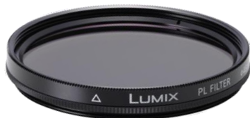
Filtre polarisant (diamètre 46mm) / DMW-LPL46E EAN : 5025232483501