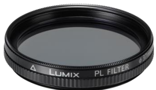
Filtre polarisant (diamètre 37mm) / DMW-LPL37GU EAN : 5025232651092