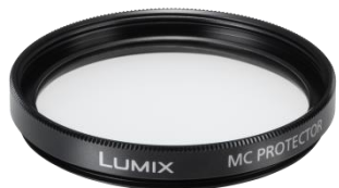
Filtre de protection (diamètre 37mm) / DMW-LMCH37GU EAN : 5025232651115