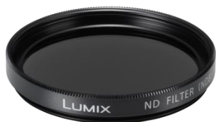
Filtre ND (diamètre 37mm) / DMW-LND37GU EAN : 5025232651108