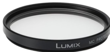
Filtre de protection (diamètre 46mm) / DMW-LMC46 EAN : 5025232438419