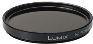
Filtre ND (diamètre 46mm) / DMW-LND46E EAN : 5025232438426