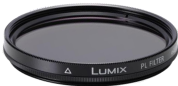
Filtre polarisant (diamètre 46mm) / DMW-LPL46E EAN : 5025232483501