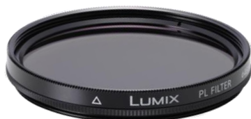
Filtre polarisant (diamètre 58mm) / DMW-LPL58GU EAN : 5025232689644