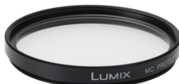
Filtre de protection (diamètre 58mm) / DMW-LMCH58GU EAN : 5025232685653