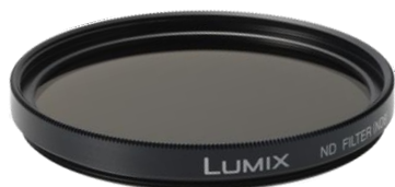
Filtre ND (diamètre 58mm) / DMW-LND58GU EAN : 5025232689651