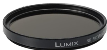
Filtre ND (diamètre 62mm) / DMW-LND62E EAN : 5025232530540