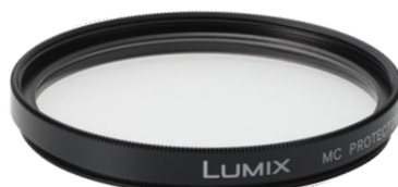
Filtre de protection (diamètre 62mm) / DMW-LMCH62E EAN : 5025232433681