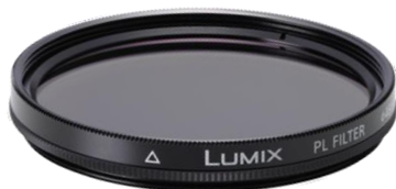
Filtre polarisant (diamètre 62mm) / DMW-LPL62E EAN : 5025232433698