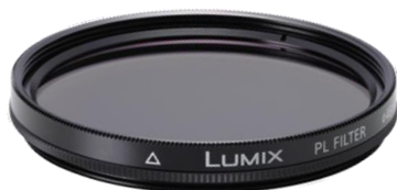
Filtre polarisant (diamètre 52mm) / DMW-LPL52E EAN : 5025232493838