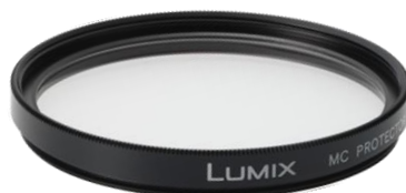
Filtre de protection (diamètre 52mm) / DMW-LMC52E EAN : 5025232245116