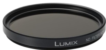
Filtre ND (diamètre 52mm) / DMW-LND52E EAN : 5025232261017