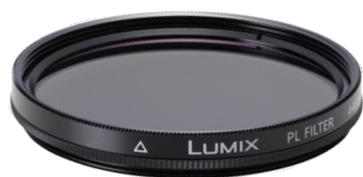
Filtre polarisant (diamètre 67mm) / DMW-LPL67E EAN : 5025232445653