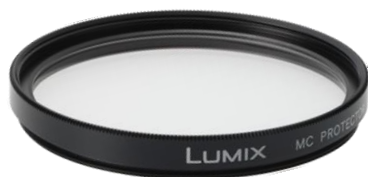
Filtre de protection (diamètre 67mm) / DMW-LMCH67E EAN : 5025232445646