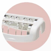
Acc. protecteur de peau