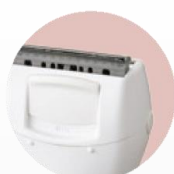
Tondeuse de précision