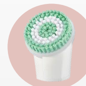
Brosse exfoliante en profondeur