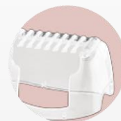
Acc. rasage (peigne)