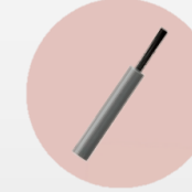
Brossette de nettoyage