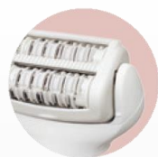
Bras / jambes