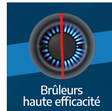
Brûleurs haute efficacité

Afin de vous éviter la corvée de nettoyage, ce four est équipé de 3 parois catalytiques autonettoyantes (latérales et de fond). Ces 3 parois catalytiques absorbent les graisses automatiquement, et de façon plus efficace.