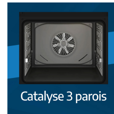
Catalyse 3 parois

La cuisson chaleur pulsée 3D vous permet de cuire sur plusieurs niveaux en même temps, grâce à une répartition de l'air chaud pulsé dans toute la cavité du four, et sans transfert de saveur.