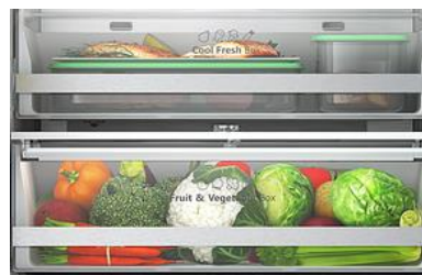
Bac à légumes avec contrôle d'humidité + Compartiment fraîcheur

Grâce au MetalTechCooling, votre réfrigérateur descendra en température plus rapidement, la stabilité de la température sera améliorée et il bénéficiera d'un design plus contemporain.