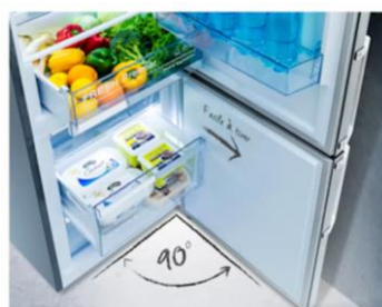
Ouverture à 90°c sans débord

Ce modèle est équipé des dernières technologies pour proposer une classe énergétique C, très économe, et un fonctionnement silencieux de 36dB.