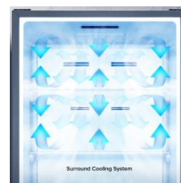
Multi Air Flow

Grâce à l'ouverture de porte sans débord, il est désormais possible d'installer le réfrigérateur directement contre un mur.