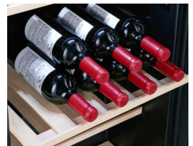
Clayettes en bois (certifiées FSC)

Deux zones de température distinctes vous permettent de stocker ensemble vos vins rouge et blanc à des températures idéales.