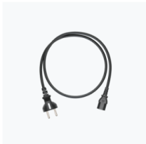
Câble d'alimentation CA DJI Power × 1