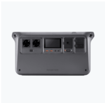
DJI Power 1 000 × 1