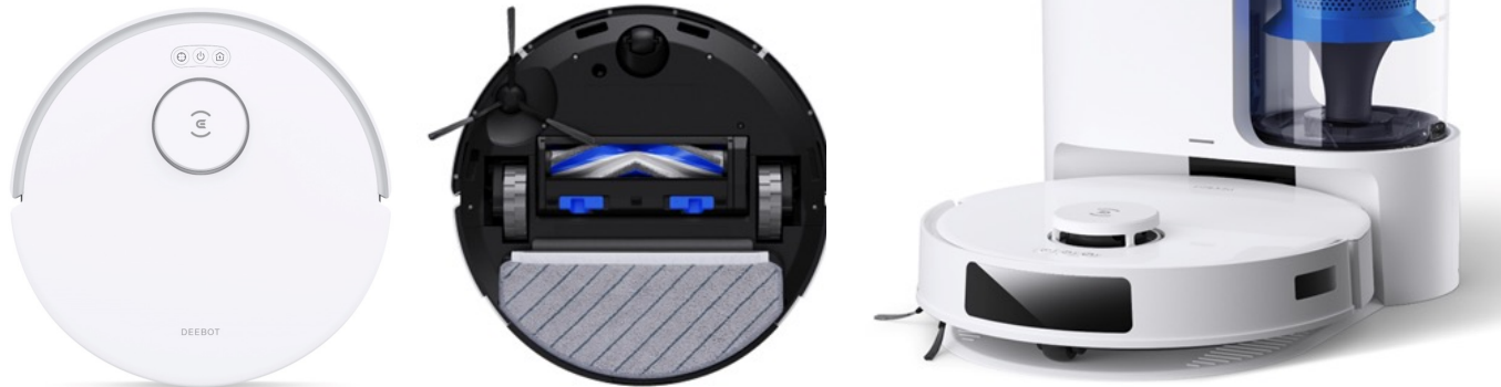
N20 PRO PLUS