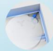
TruEdge 2.0 Adaptive Edge Cleaning Technology