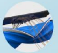
ZeroTangle 2.0 Anti-tangle Technology