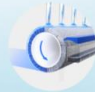
OZMO ROLLER Water Renewal Mopping System