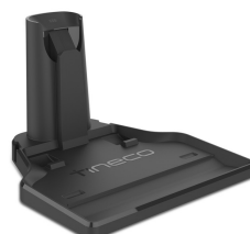
Station d'accueil avec charge intégrée