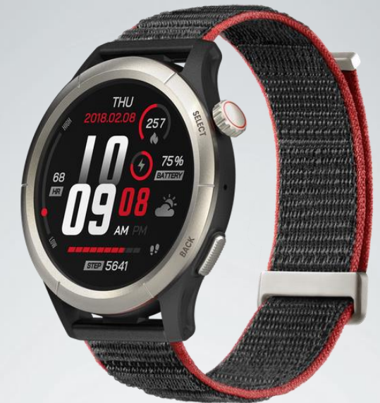
Run Track Black (Titanium Alloy Bezel)