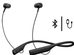
Casque USB audio et Bluetooth® SBH90C