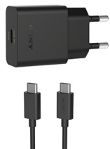
Chargeur rapide UCH32C