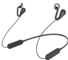
Casque stéréo Open-ear Bluetooth® SBH82D