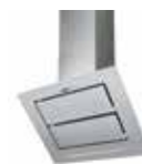
HOTTE MURALE INCLINÉE VIZIO ▶ p. 170