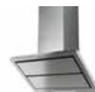
HOTTE MURALE IN- CLINÉE VIMEA ▶ p. 164