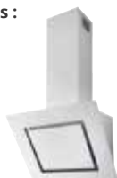
HOTTE MURALE INCLINÉE VENUS ▶ p. 136