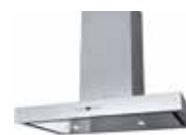
HOTTE MURALE BOX LIDO ▶ p. 186