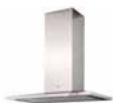
HOTTE MURALE BOX IRIS ▶ p. 184