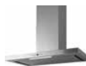
HOTTE MURALE BOX OSMOSE ▶ p. 180