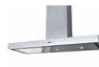
HOTTE ÎLOT LIDO ▶ p. 198