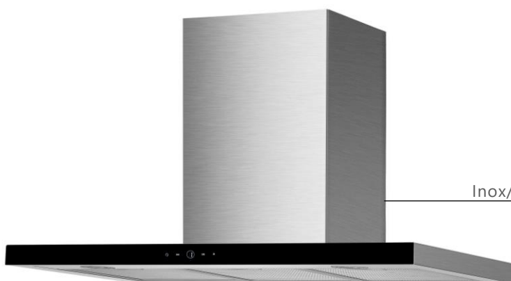
Inox/Verre noir 90