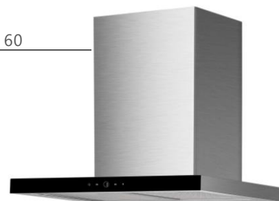
Inox/Verre noir 60

Bandeau : inox/verre noir Cheminée : Inox