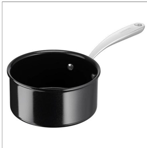
Casserole céramique, Desideria, 16 cm (1.5 L) 1 à 2 pers CASSEROLE - 16 CM 010275031116