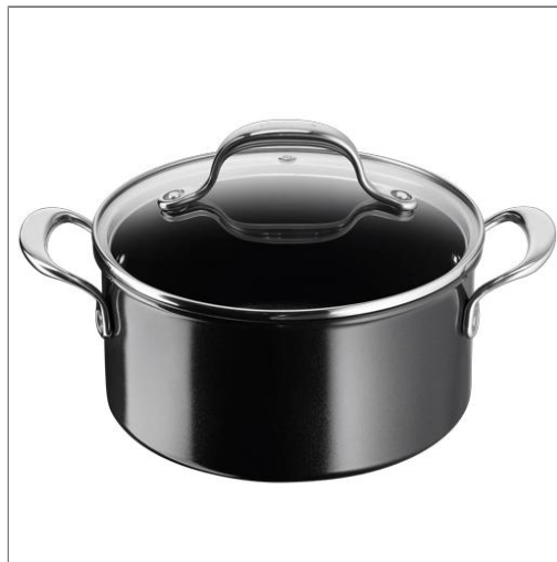
Faitout céramique avec couvercle, Desideria, 20 cm (3L) 3 à 4 pers