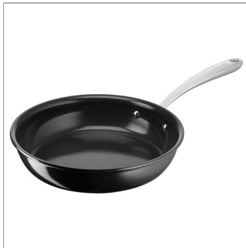
Poêle céramique, Desideria, 24 cm POÊLE - 24 CM 010275040124