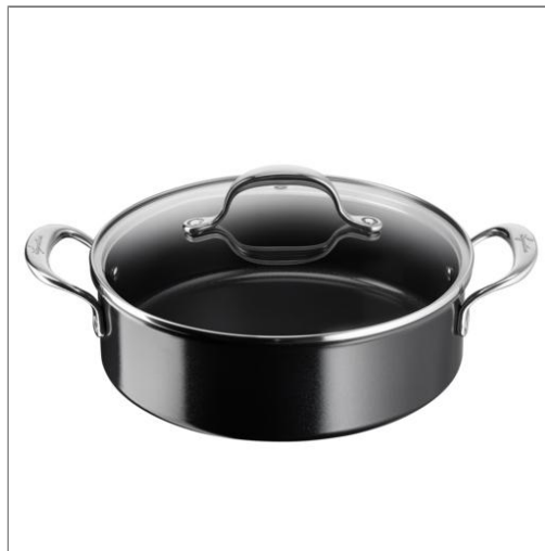
LAGOSTINA Sauteuse Desideria 26 cm, Revêtement en céramique antiadhésif, Conçu pour durer SAUTEUSE - 26 CM 010275032026