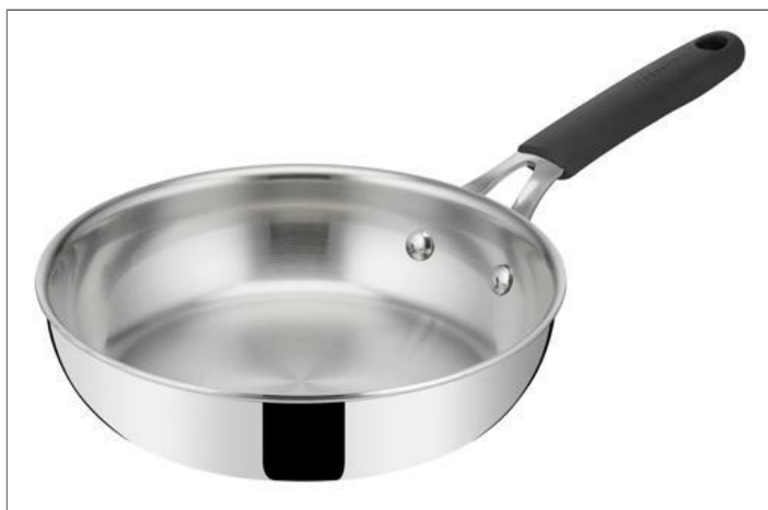
Esperta Triply Poêle 20 cm Poêle 20 cm 012909040120