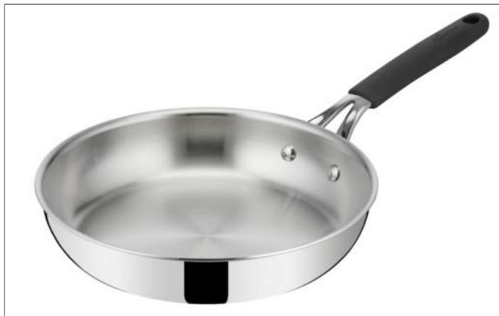
Esperta Triply Poêle 28 cm Poêle 28 cm 012909040128