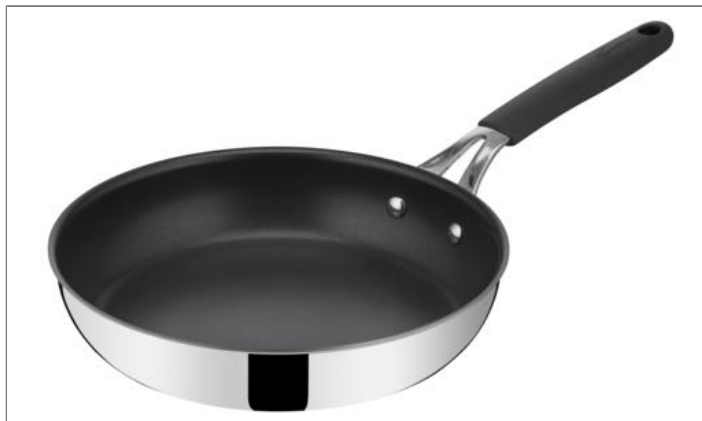
Esperta Triply Poêle revêtue 24 cm Poêle 24 cm 012909041124