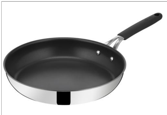
Esperta Triply Poêle revêtue 28 cm Poêle 28 cm 012909041128