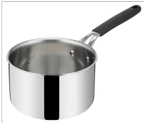
Esperta Triply Casserole 20 cm Casserole 20 cm 012909031120