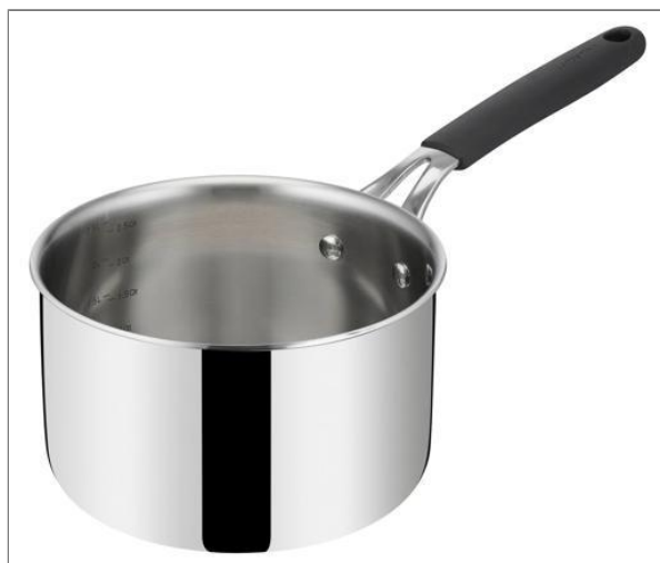
Esperta Triply Casserole 20 cm Casserole 20 cm 012909031120