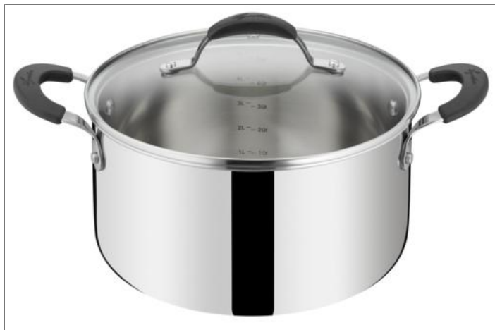
Esperta Triply Faitout 24 cm Faitout 24 cm 012909031224