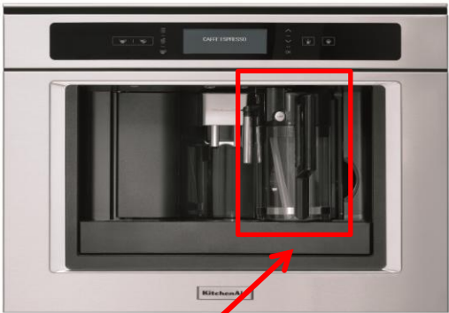
Pot à lait pour Cappuccino/ Café Latte