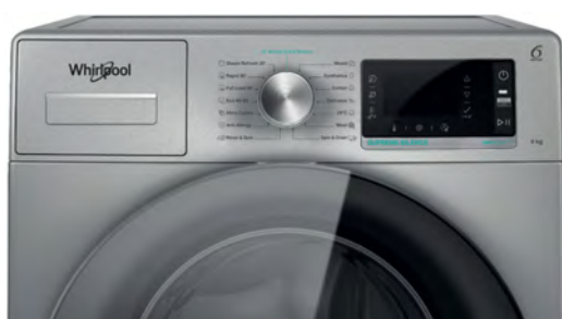
Bandeau de commande avec zone de saisie tactile Programmation facile et intuitive

Ce traitement élimine jusqu'à 99,9%* de la plupart des bactéries.