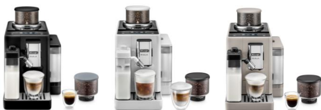
NOIR ONYX FEB4455.B