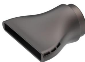
CONCENTRATEUR RAPIDE BUSE MAGNETIQUE 360°

Diffuseur pour la définition d'ondulations et de boucles.