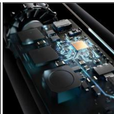
CONTRÔLE NUMÉRIQUE DE LA CHALEUR

Concentrateur professionnel qui dirige et accélère le flux d'air pour un séchage précis en préparation du coiffage