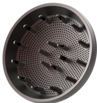
DIFFUSEUR PROFESSIONNEL BUSE MAGNETIQUE 360°

Concentrateur étroit professionnel avec microparticules de céramique qui émettent une bonne chaleur pendant le coiffage. Il génère une force d'air élevée qui assure un séchage plus rapide et un coiffage plus efficace