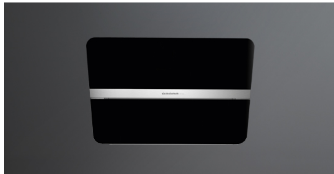
The photograph is purely for information It may not correspond to the selected version.